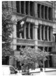
Du học New York hiện là mơ ước của nhiều người trẻ Việt Nam bởi đó là "thành phố đại học", thành phố đông dân nhất Hoa Kỳ, còn được gọi bằng những cái tên ấn tượng như "Thành phố không bao giờ ngủ" hay "Quả táo lớn".