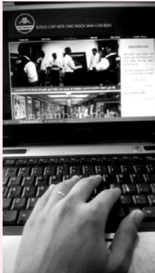
Tạo ra sản phẩm riêng và đưa lên web sẽ rất dễ thu hút người dùng.

Theo một chuyên gia mạng, có DN trong ngành siêu thị đã yêu cầu nhân viên phải truy cập web thường xuyên. "Nếu tính công ty này có khoảng