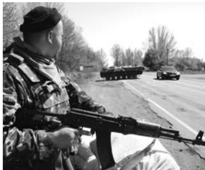
Lực lượng tự vệ canh gác ở cửa ngõ Slaviansk (miền Đông) ngày 25-4.

Đầu mối của Mỹ ở Ukraine là Oleh Rybachuk, nguyên Phó Thủ tướng dưới thời Thủ tướng Tymoshenko. Hàng chục nhóm đối lập do Oleh Rybachuk thành lập đã đưa nhau biểu tình dẫn đến lật đổ Tổng thống Yanukovich. Chỉ trong năm 2013, Cơ quan Phát triển quốc tế Mỹ (USAID) đã bơm cho Oleh Rybachuk hơn 7 tỉ USD thông qua quỹ Soros và quỹ Pact ở Mỹ.