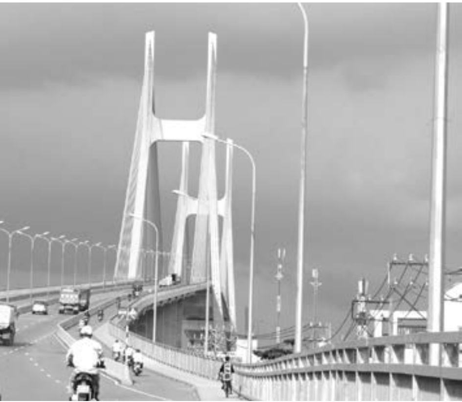
Cầu Phú Mỹ là một công trình được ngợi ca ở TP.HCM nhưng chỉ riêng mức đội vốn của công trình này đã đủ để xây cầu Sài Gòn 2.