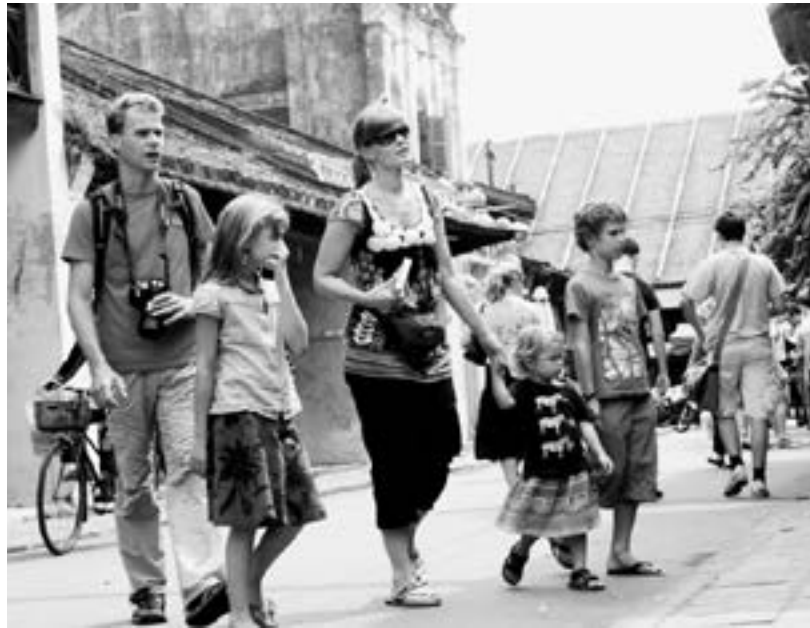
Hội An sẽ khắc phục hình ảnh thiếu thân thiện của lực lượng soát vé của du khách.