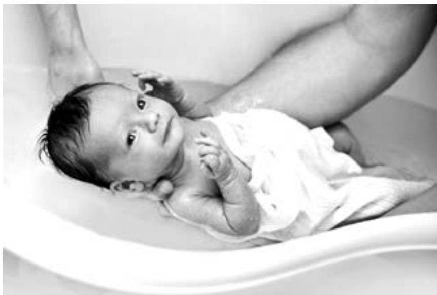
Khi trẻ mắc bệnh sỏi thì nên tắm trẻ bằng nước ấm, có thể pha ít muối biển để giảm ngứa.

Cần theo dõi nhiệt độ cho trẻ thường xuyên, nếu thấy không hạ thì phải đưa trẻ đến bệnh viện kịp thời. Tránh tự ý sử dụng các thuốc giảm đau hạ sốt cho trẻ vì dễ gây thêm biến chứng.