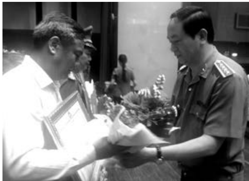
Bộ trưởng Bộ Công an Trần Đại Quang trao bằng khen cho các cá nhân, tập thể có thành tích trong công tác phòng, chống và kiểm soát ma túy.

(PL)- “Công an TP.HCM cần phát huy vai trò nòng cốt trong phòng, chống và kiểm soát ma túy; tập trung triệt phá các đường dây, tổ chức vận chuyển, mua bán ma túy; kiểm soát chặt chẽ tình trạng thâm lậu ma túy từ bên ngoài vào TP; đẩy mạnh điều tra, phát hiện, bắt giữ đối tượng mua bán, vận chuyển, tàng trữ và tổ chức sử dụng trái phép các chất ma túy”. Bộ trưởng Bộ Công an Trần Đại Quang đã phát biểu như trên tại hội nghị tổng kết năm năm thực hiện Chỉ thị số 21-CT/TW của Bộ Chính trị về tiếp tục tăng cường lãnh đạo, chỉ đạo công tác phòng, chống và kiểm soát ma túy trong tình hình mới sáng 26-4 tại TP.HCM.