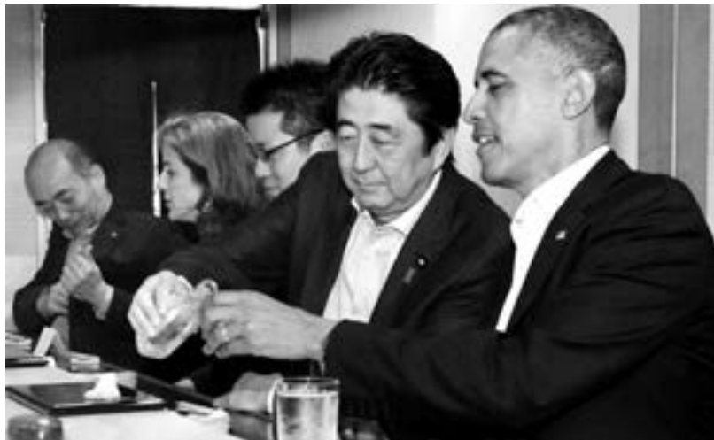
Thủ tướng Nhật Abe cùng ly với Tổng thống Obama trong nhà hàng sushi "ngon nhất thế giới".

Nước Mỹ cần một cách tiếp cận chiến lược mới trong tình hình hiện nay, tuy vậy châu Á-Thái Bình Dương là một khu vực quá quan trọng vì nơi đây vừa đóng vai trò là động lực tăng trưởng, vừa là sân chơi truyền thống nhưng lại bị Mỹ bỏ quên suốt hơn 10 năm. Chuyến đi này là cơ hội để nước Mỹ chuyển thông điệp tới TQ: Lần trước chỉ là do sơ suất, Mỹ