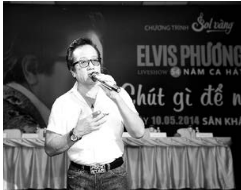
Chuỗi liveshow Sol Vàng với nhân vật chính đầu tiên là ca sĩ Elvis Phương sẽ là một trong những chương trình ca nhạc hiếm hoi trên sóng truyền hình dành cho khán giả trung niên.

Khi đã có Dấu ấn và Tôi tỏa sáng , nhà sản xuất Jet Studio vẫn cho ra mắt Sol Vàng . Và Sol Vàng dự kiến cũng sẽ là chương trình với những nhân vật đặc sắc với dòng nhạc xưa. Bởi đối tượng khán giả dành cho Dấu ấn hay Tôi tỏa sáng vẫn là khán giả