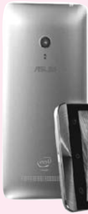
Hiện nay dưới 2 triệu đồng đã có smartphone dùng chip Intel.

Thế nhưng cuộc chiến ở phân khúc phổ thông vẫn chưa dừng