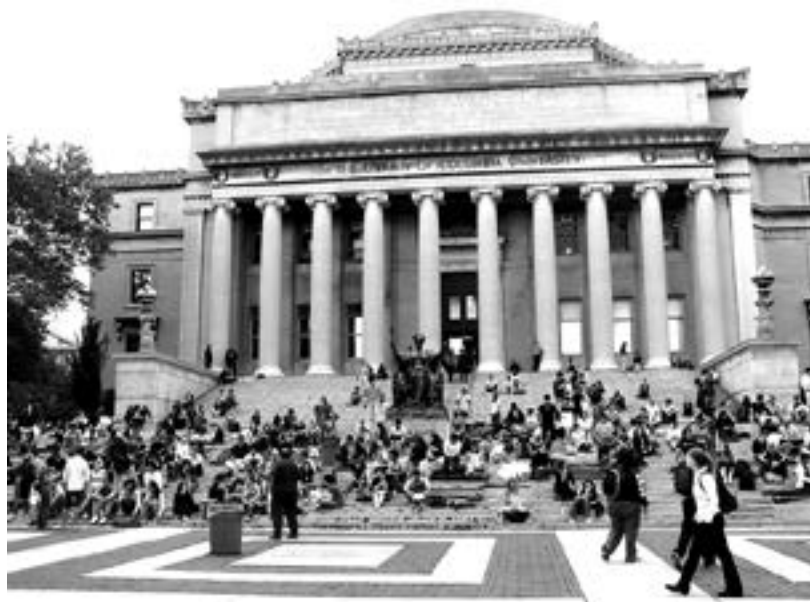
Có hơn 500.000 bạn trẻ đến học tập tại 110 cơ sở giáo dục ĐH nằm rải rác khắp TP New York.

- St John's: ĐH Công giáo tư nhân với 20.000 sinh viên. ĐH St John's đặc biệt có các chương trình chuyên môn hóa như kinh doanh (22% trong tổng