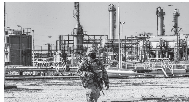
Quân đội Mỹ đồn trú ở mỏ khí Conoco tại tỉnh Deir ez-Zor (Syria).

Trước đó, hôm 12-8, một UAV đã tấn công vào một xe chở quân của các lực lượng ủng hộ chính quyền Damascus khiến sáu binh lính thiệt mạng và 14 người