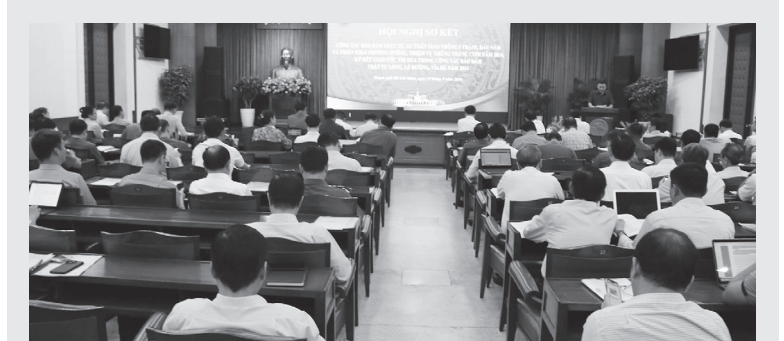
Toàn cảnh hội nghị.