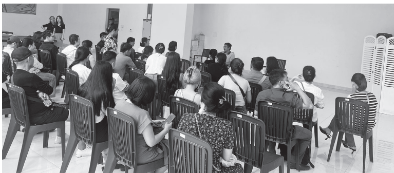
Cư dân cùng ban quản lý tổ chức đối thoại để giải quyết nhưng không thành. Ảnh: ĐẶNG LÊ

Ban quản lý chung cư Millennium Masteri thông báo về việc sử dụng căn hộ cho thuê ngắn ngày là hành vi bị nghiêm cấm. Ảnh: ĐẶNG LÊ