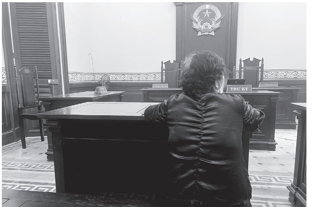
Đại diện nguyên đơn tại phiên tòa phúc thẩm.

Tuy nhiên, trước đề xuất trên của nguyên đơn, phía bị đơn cho rằng với diện tích không gian đang tranh chấp rất nhỏ và khó xác định như vậy mà yêu cầu 1 tỉ đồng là không có căn cứ nên không đồng ý thương lượng, hòa giải và đề nghị HĐXX bác kháng cáo của nguyên đơn, giữ nguyên bản án sơ thẩm.