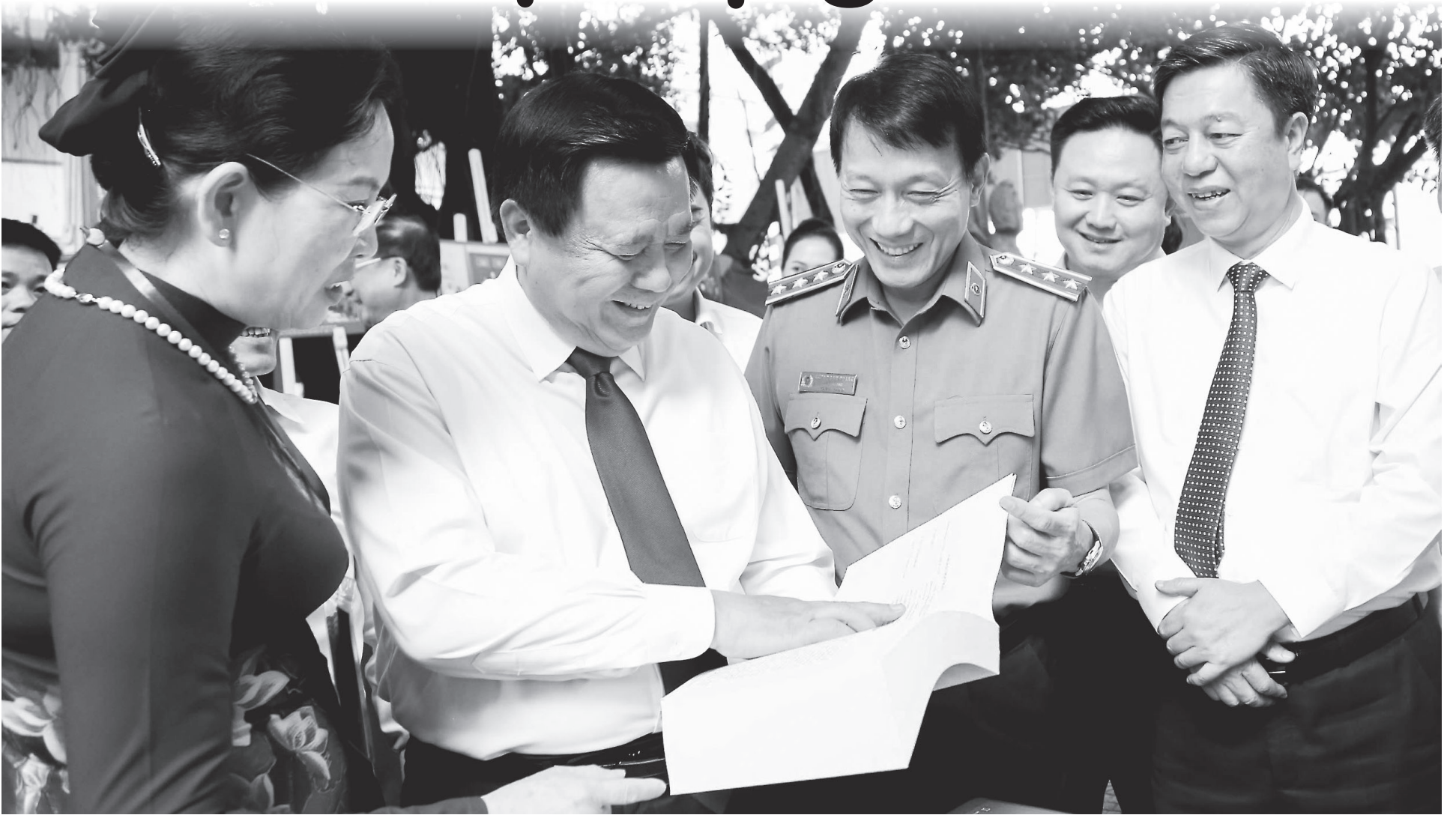
GS-TS Nguyễn Xuân Thắng, Giám đốc Học viện Chính trị Quốc gia Hồ Chí Minh, Chủ tịch Hội đồng Lý luận Trung ương (thứ hai từ trái); Bộ trưởng Bộ Công an Lương Tam Quang và các đại biểu tham quan gian trưng bày sách bên lễ hội thảo.