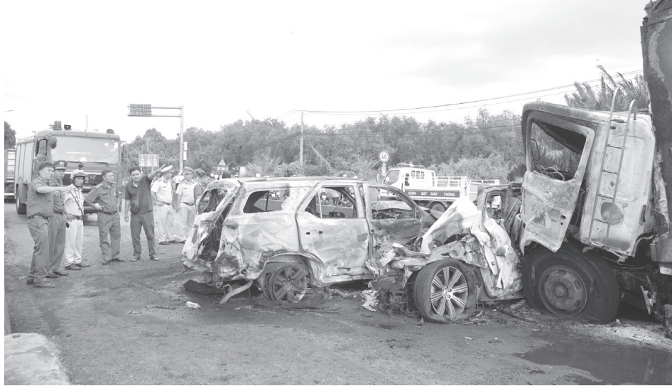
Hiện trường vụ tai nạn liên hoàn giữa nhiều ô tô dưới dầm cầu Phú Mỹ, TP Thủ Đức (TP.HCM) vào ngày 8-8.

Trước đó, Pháp Luật TP.HCM đã thông tin khoảng 14 giờ 50 ngày 8-8, camera an ninh ghi lại cảnh xe tải thùng đông