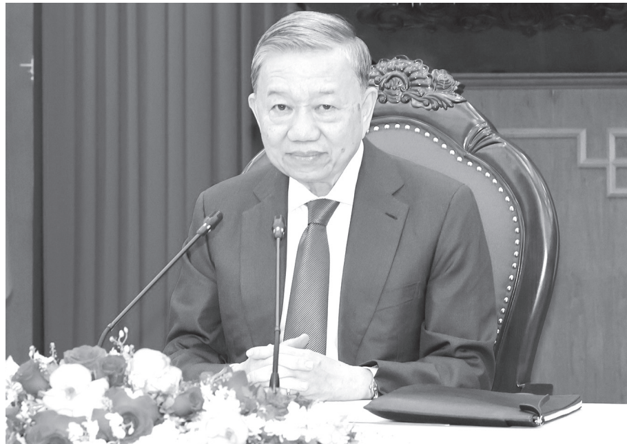
Tổng Bí thư, Chủ tịch nước Tô Lâm.

Theo thông cáo của Bộ Ngoại giao, nhận lời mời của Tổng Bí thư, Chủ tịch nước Trung Quốc (TQ) Tập Cận Bình và phu nhân, Tổng Bí thư, Chủ tịch nước Tô Lâm và phu nhân sẽ thăm cấp Nhà nước đến TQ từ ngày 18 đến 20-8.