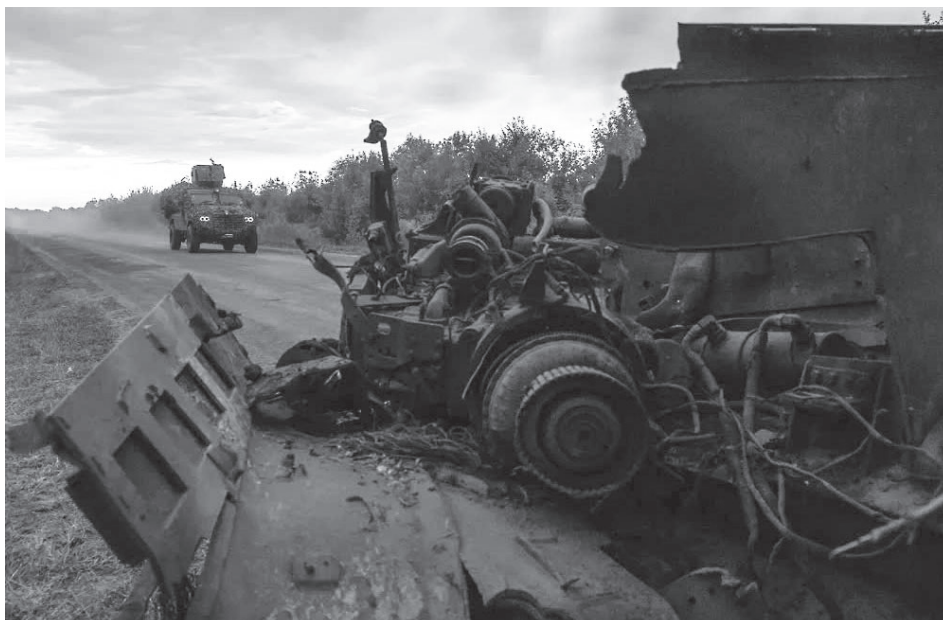
Xe quân sự của Ukraine tại tỉnh Sumy (Ukraine, giáp tỉnh Kursk của Nga) ngày 13-8.

Đồng quan điểm, Bộ trưởng Bộ Nội vụ Ukraine Ihor Klymenko cho rằng việc tạo