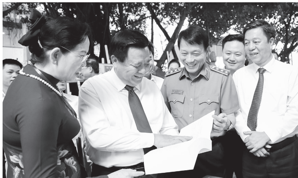
GS-TS Nguyễn Xuân Thắng, Giám đốc Học viện Chính trị Quốc gia Hồ Chí Minh, Chủ tịch Hội đồng Lý luận Trung ương (thứ hai từ trái); Bộ trưởng Bộ Công an Lương Tam Quang và các đại biểu tham quan gian trưng bày sách bên lề hội thảo.

Lực lượng CAND đã phối hợp chặt chẽ với Quân đội nhân dân, các bộ, ngành, địa phương, các tổ chức chính trị - xã hội, dựa vào Nhân dân để xây dựng lực lượng CAND cách mạng, chính quy, tinh nhuệ, hiện đại. Phấn đấu hoàn thành xuất sắc nhiệm vụ bảo vệ vững chắc an ninh quốc gia, bảo đảm trật tự, an toàn xã hội, góp phần vào thực hiện thắng lợi nhiệm vụ phát triển kinh tế - xã hội và mở rộng đối ngoại của đất nước.