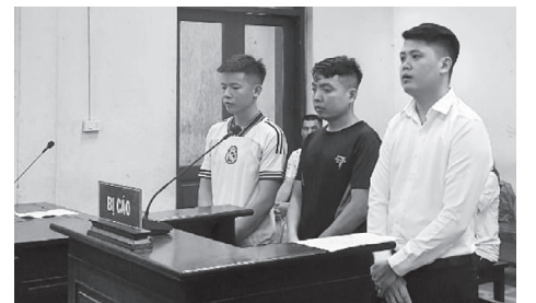
Các bị cáo tại phiên tòa.

Theo đại diện VKS, nếu đúng là nhầm lẫn, khi cắm chìa khóa nhưng không mở được xe, bị cáo sẽ tìm cách kiểm tra, xem biển số xe đó có phải xe của mình không