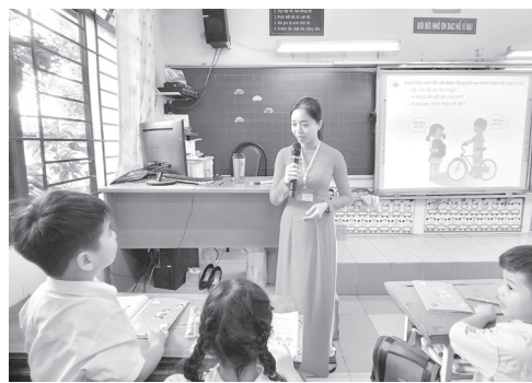
Một tiết học của học sinh Trường Tiểu học Lương Thế Vinh (quận Gò Vấp, TP.HCM).

Đối với các trường liên cấp tiểu học - THCS, cần thực hiện biên chế cán bộ quản lý, GV, nhân viên đảm bảo cơ cấu, thành phần, số lượng theo các quy định. Trong đó,