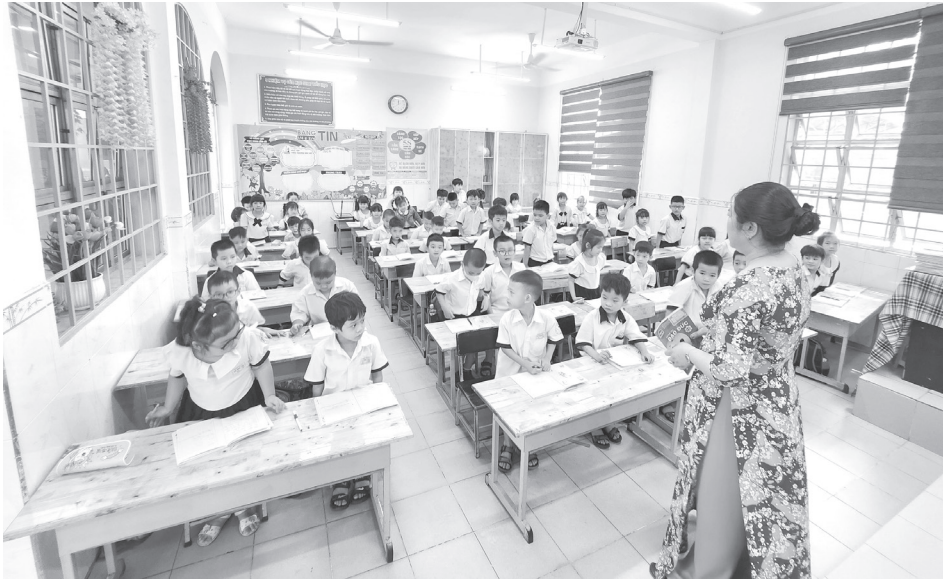
Một lớp học tại Trường Tiểu học Lê Văn Thọ (quận 12, TP.HCM).

Ngoài ra, theo ông Thanh, giải pháp lâu dài đối với quận Gò Vấp và một số quận, huyện