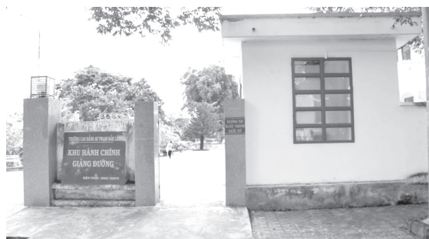
Trường CĐ Sư phạm Đắk Lắk, nơi xảy ra nhiều vi phạm về tuyển sinh.

Năm học 2022-2023, trường vẫn lặp lại thiếu sót, tuyển 55/42 chỉ tiêu, vượt 13 chỉ tiêu. Đến nay có 52 thí sinh đã dự thi tốt nghiệp, đạt tốt nghiệp vào tháng 6-2023 nhưng chưa được cấp bằng tốt nghiệp.