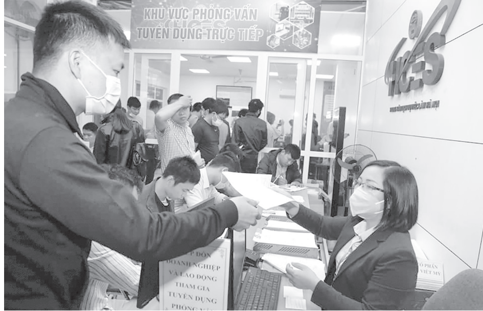
Người lao động nộp hồ sơ xin việc làm.

Bà A làm đơn xin nghỉ việc theo quy định của pháp luật lao động và ngày 1-7-2015, Trường Tiểu học E ban hành