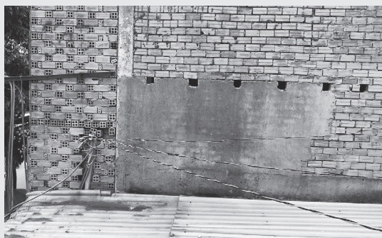
Bức tường trong phần không gian đang tranh chấp tại tòa.

Bên cạnh đó, cấp sơ thẩm tuyên buộc vợ chồng ông