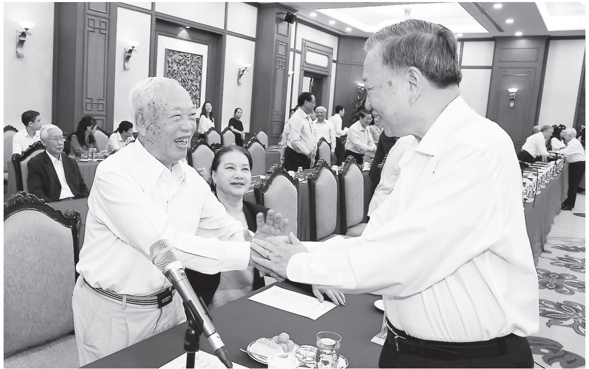
Tổng Bí thư, Chủ tịch nước Tô Lâm và nguyên Chủ tịch Quốc hội Nguyễn Văn An.

Đó là những lời chỉ dẫn quý báu, là ngọn đuốc soi đường, là sức mạnh thôi thúc hành động của cả dân tộc trong công cuộc đấu tranh giành độc lập, tự do, xây dựng và bảo vệ Tổ quốc.