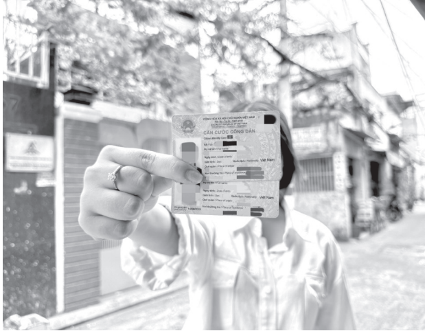
Công dân không phải nộp lệ phí khi được cấp thẻ căn cước lần đầu.

Cụ thể, trẻ em theo quy định tại Luật Trẻ em; người cao