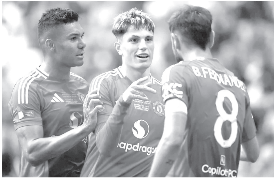
Manchester United được chọn là CLB đầu tiên đá quả bóng khai mạc Premier League 2024-2025.

Leny Yoro, Joshua Zirkzee, Matthijs De Ligt và Noussair Mazraoui đã đến để tăng cường sức mạnh cho đội hình của HLV Ten Hag với mức phí