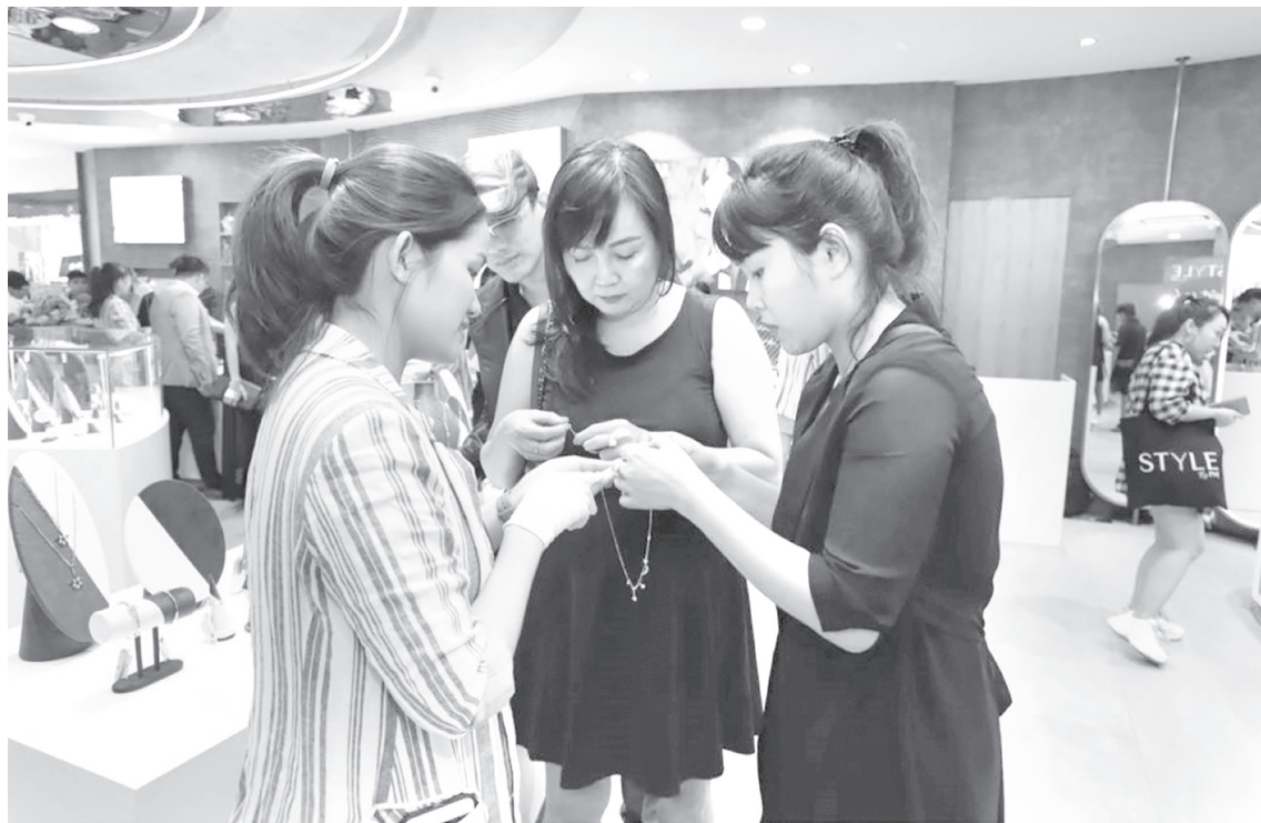
PNJ đã thắng lớn trong sáu tháng đầu năm 2024 với lợi nhuận sau thuế gần 1.200 tỉ đồng.

Bức tranh kinh doanh của Vietnam Airlines có sự đảo chiều ngoạn mục. Lũy kế nửa đầu năm 2024, hãng hàng không này đã có lợi nhuận vượt hơn 5.000 tỉ đồng, trong khi cùng kỳ lỗ đến