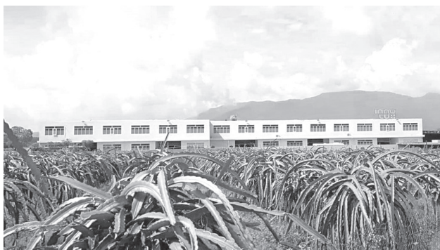
Một khu đất chuyển mục đích sai quy định tại huyện Hàm Tân mà Cơ quan CSĐT Công an tỉnh Bình Thuận đang xác minh, làm rõ.

Sở TN&MT đề nghị Cơ quan CSĐT công an tỉnh điều tra dấu hiệu vi phạm pháp luật theo quy định tại Điều